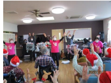
陸川様とゆかいな仲間様